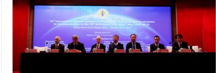
第13届国际推进剂、炸药、烟火技术秋季研讨会暨丁徽先生诞辰95周年纪念会