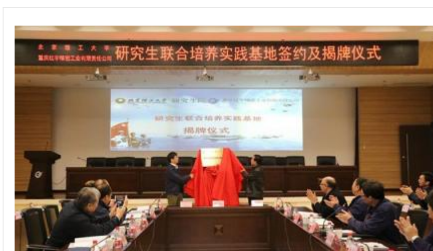
北理工与重庆红宇精密工业有限责任公司举行研究生联合培养实践基地签约和揭牌仪式

传承“红色基因”，砥砺“军工品格”，树立“报国志向”，为党为国精雕细琢又红又专的一流人才，兵器学科使命在肩、奋斗不辍。