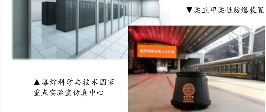
▲爆炸科学与技术国家重点实验室仿真中心