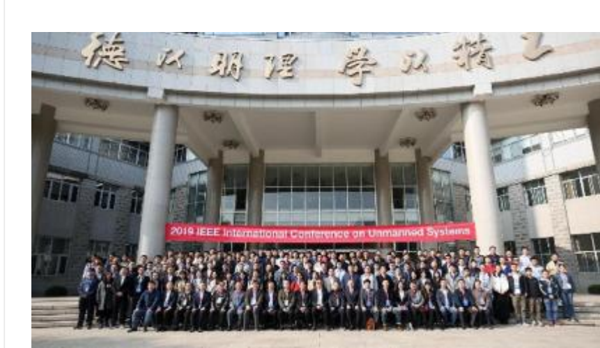
无人系统国际会议