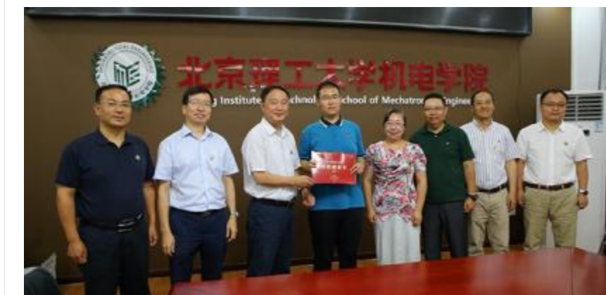
▲北理工现场颁发2019年第1940号录取通知书